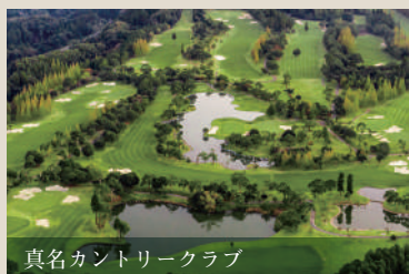
真名カントリークラブ