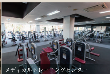
メディカルトレーニングセンター